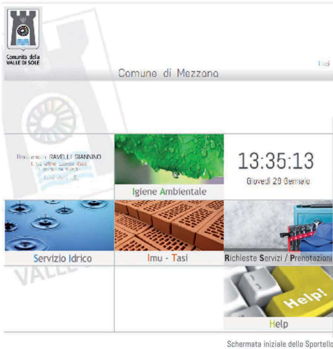
Schermata iniziale dello Sportello

GarbageSportello è un'applicazione realizzata in ambiente web che consente ad ogni contribuente di visualizzare la propria situazione tributaria e di scaricare la documentazione necessaria al controllo ed al pagamento dei tributi. Il contribuente può controllare i propri dati anagrafici e comunicare variazioni.